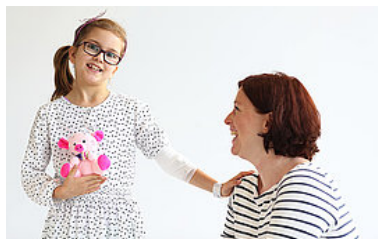
Soziale und pädagogische Berufe >