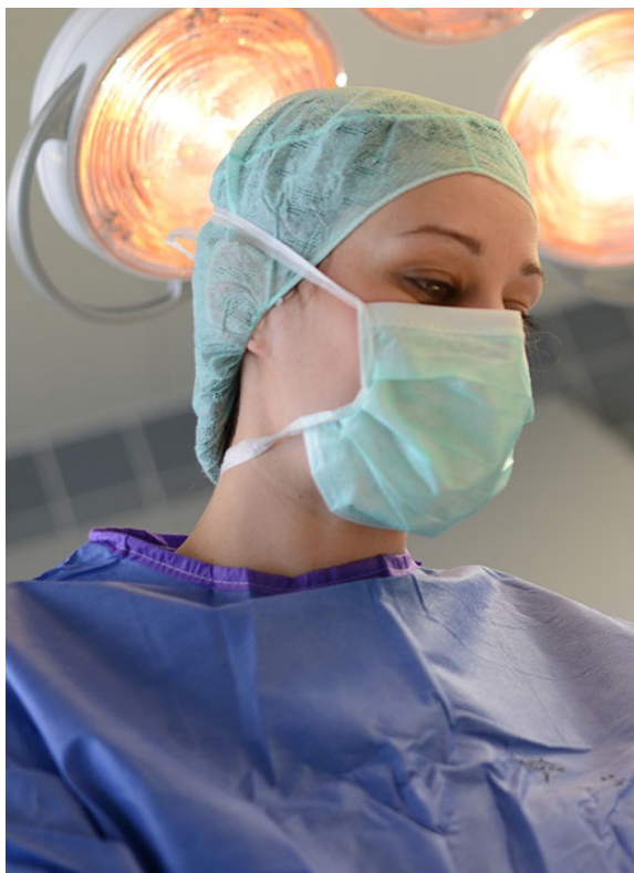
Ärztliche Berufe >