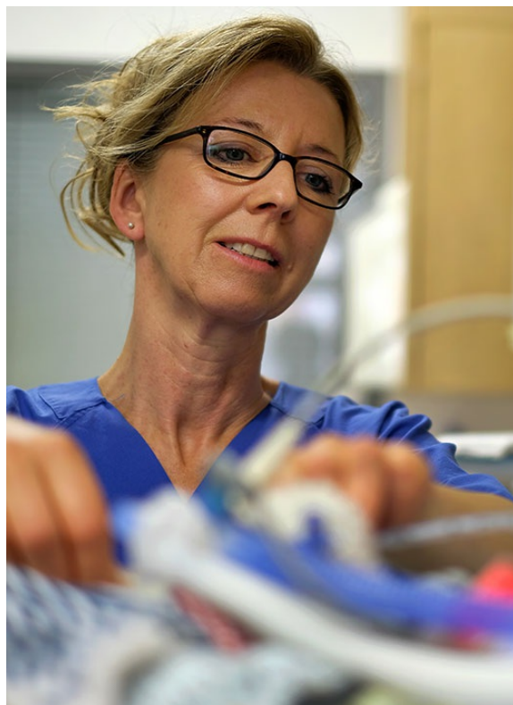
Pflegerische Berufe >