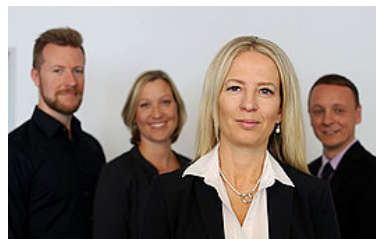
Kaufmännische Berufe / Management >