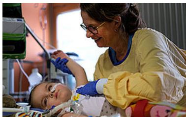
Therapeutische Berufe >