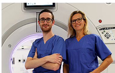
Medizinisch-technisch orientierte Berufe >