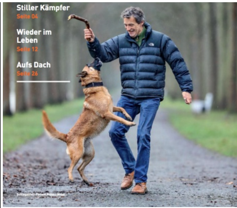
visite 01/18 >